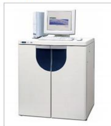
全自动氨基酸分析仪