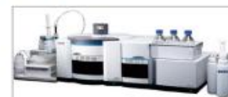
原子荧光形态分析仪