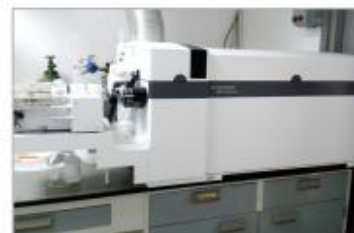
电感耦合等离子体质谱