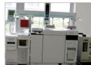
气相色谱串联质谱仪