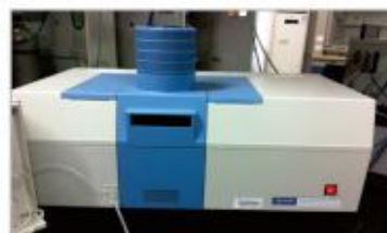
原子荧光分光光度计