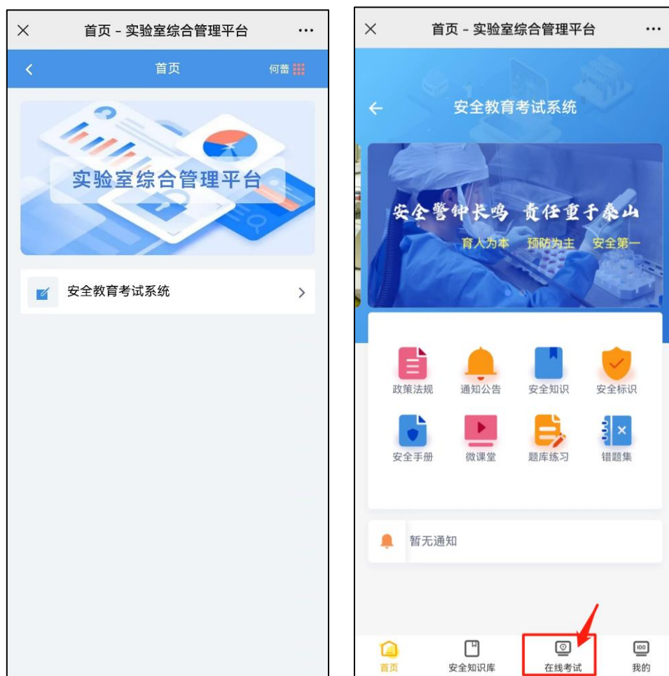
图2 手机端登录界面