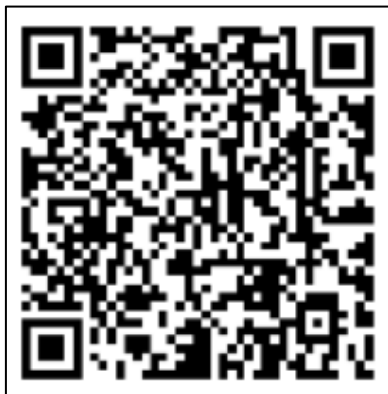
图1 扫描二维码登录手机端

手机微信扫描下图二维码，通过单点登录（我的商大账号密码）进入考试系统，点击“安全教育考试系统”进入主页。