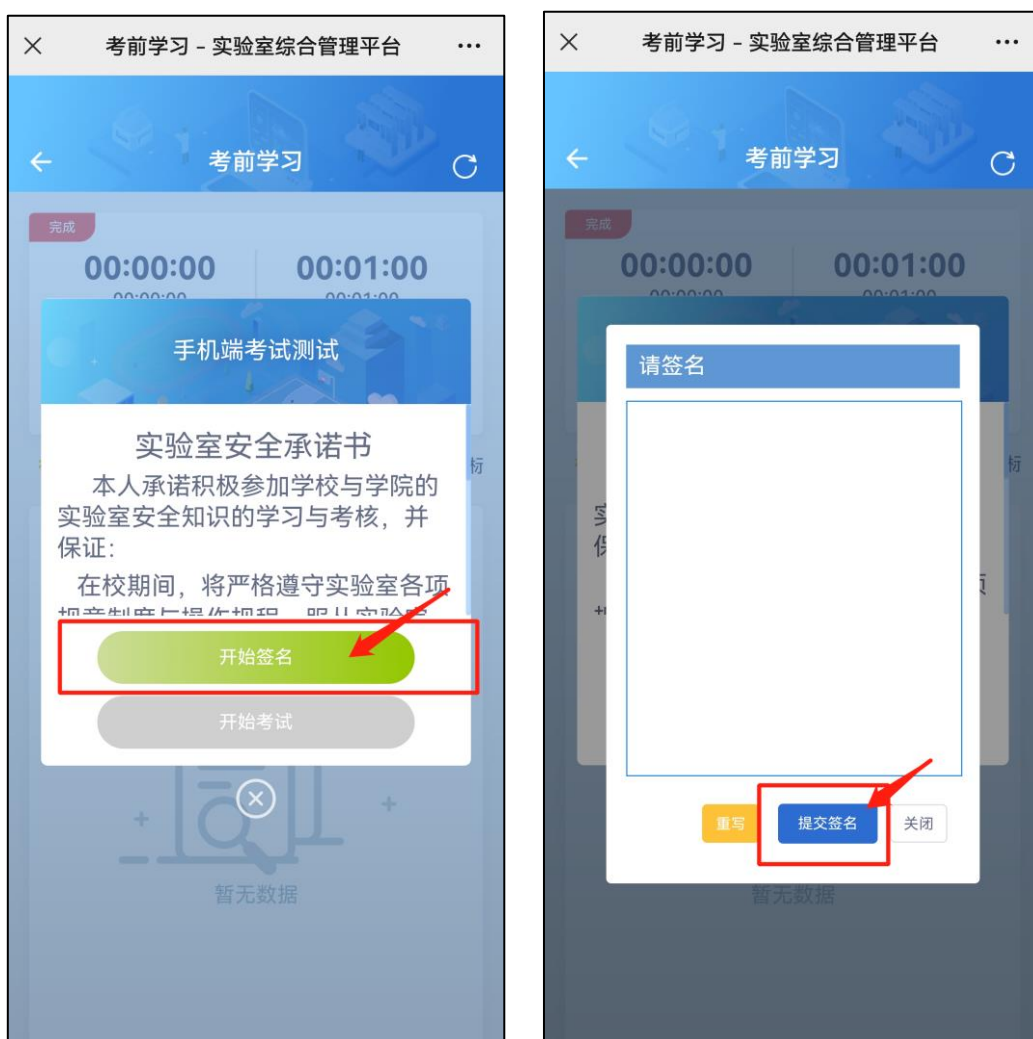
图 6 考前承诺界面

4. 签署考前承诺： 正式考试前需要签署考前承诺书，在弹窗中点击【开始签名】，签名完成并提交后，即可正式考试。