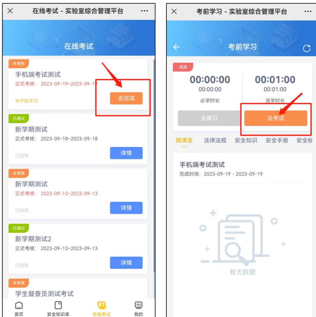
图 5 进入考试界面

3. 进入考试与考前承诺：正式考试开启后，即可进行考试。从【在线考试】进入，选择对应的考试项目，点击【去考试】。