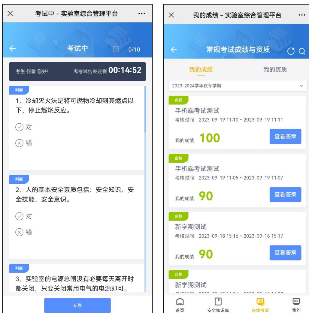
图 7 考试界面及成绩界面