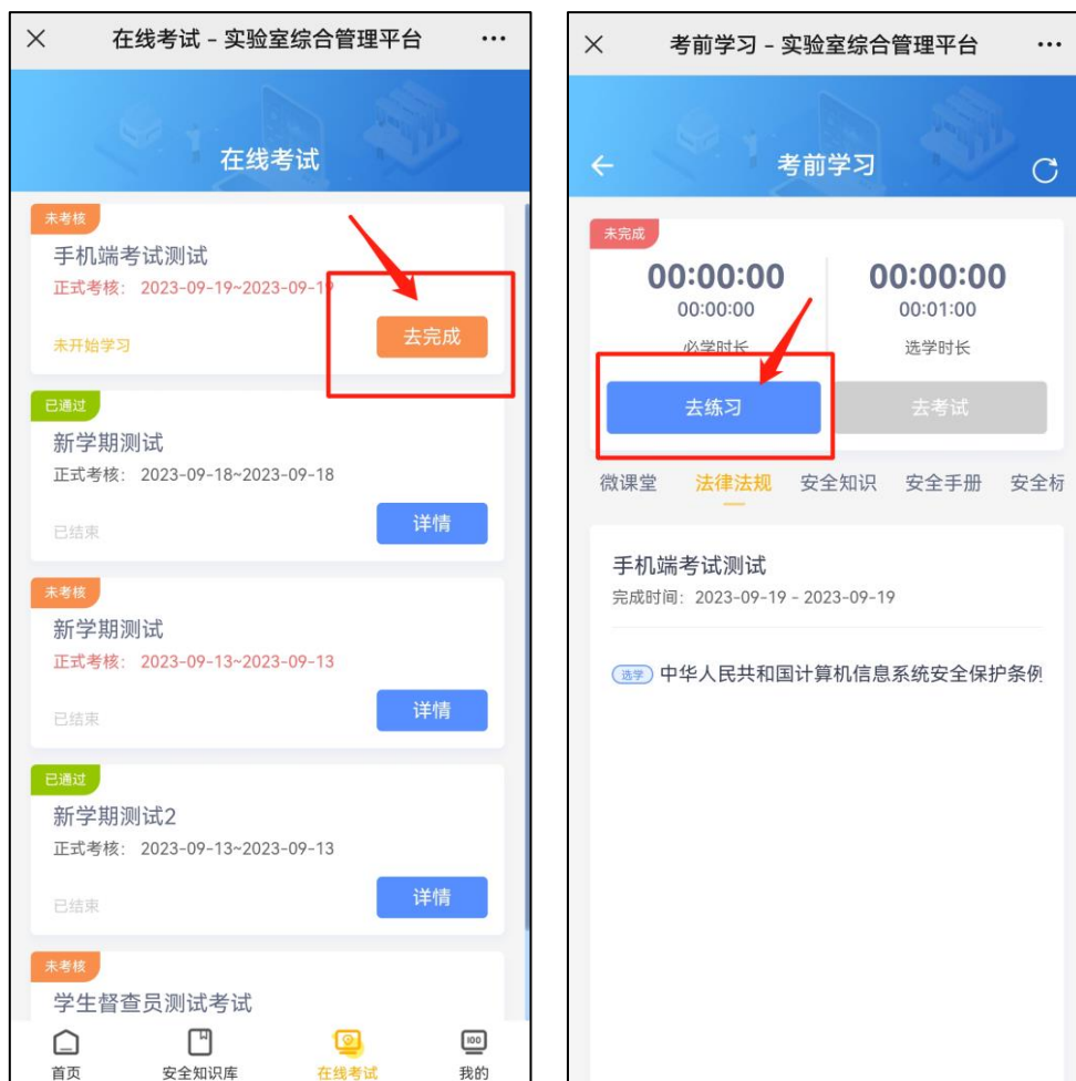
图 4 考前练习界面

2. 考前练习：在考试前，请考生自行进行习题练习。点击底下菜单栏的【在线考试】，选择对应考试项目，点击【去完成】，进入考前学习界面，点击【去练习】即可开始习题练习。