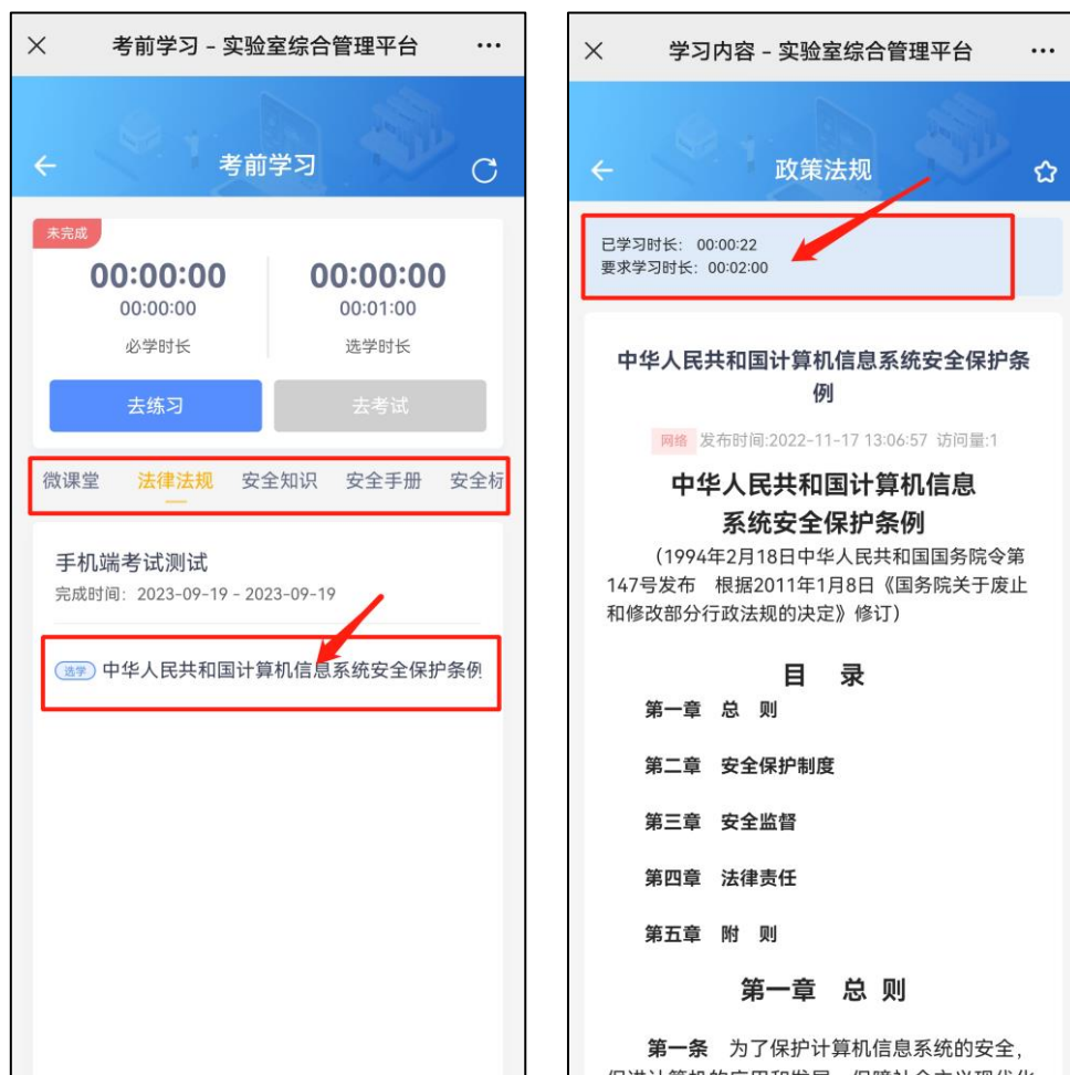
图 9 进行必学内容学习

7. 必学内容 ：若该考试项目有指定必学内容，请在进入考试项目后，点击下方学习内容进行学习，学习过程中系统会自动计时，当完成所有必学内容的学习时长后，才可参加考试。（该部分计时统计会有延迟，完成学习内容后请刷新页面，等待统计完成。）